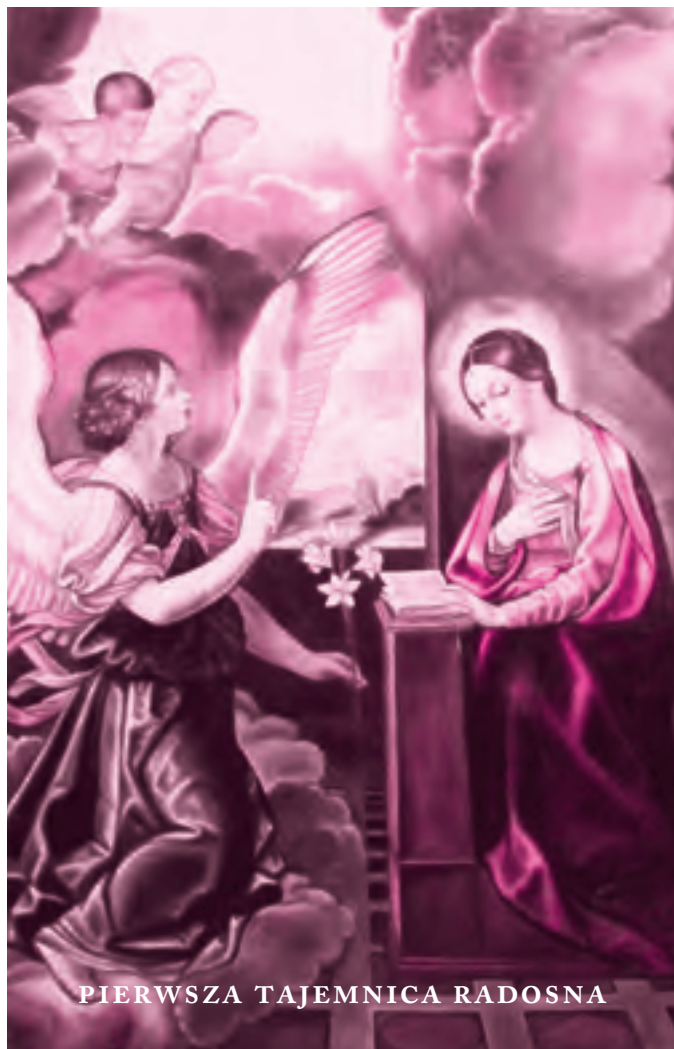
PIERWSZA TAJEMNICA RADOSNA