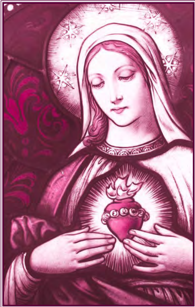
Niepokalane Serce Maryi